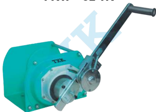
PNW - 03 TN